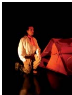
Contes Zé Légendes...