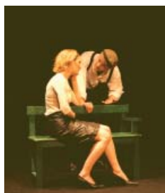
Manuel à Usage des Amoureux