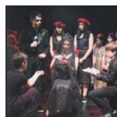
Perséphone Opéra pOp