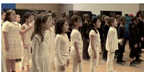
le Roi du Jazz

de la Chorale à L'Opéra (Opéra et musique classique par la chorale), du Tableau à l'Image (Histoire de l'art par mise en scène et photographie), du Tableau à la Scène (langage de l'image par l'écriture et le théâtre), Il était une fois le Conte (découverte du patrimoine locale et écriture de conte).