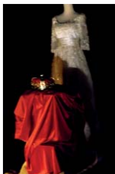
Moi, le violon