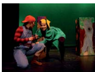
Sur les Chemins Magiques de La Fontaine