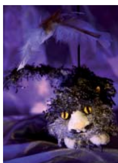
La Princesse sans Sommeil