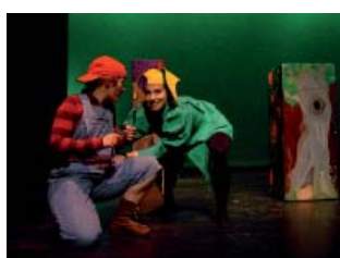
Sur les Chemins Magiques de La Fontaine