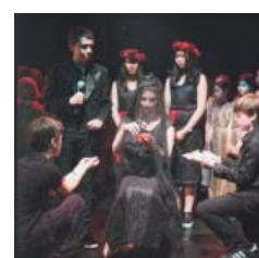
Perséphone Opéra pOp