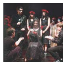
Perséphone Opéra pOp