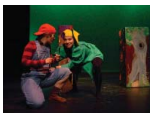
Sur les Chemins Magiques de La Fontaine