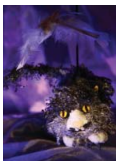
La Princesse sans Sommeil

Il y a eu Manuel à Usage des Amoureux , Sur les Chemins Magiques de La Fontaine , Contes Zé légendes (série théâtrale - 5 opus), la Princesse sans Sommeil , GAMME D'AMOUR (récital d'airs de Tosti en guitare ou piano voix), Moi, Le Violon , et prochainement Hansel et Gretel et Phèdre .