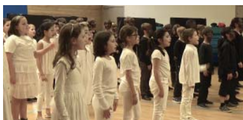
le Roi du Jazz