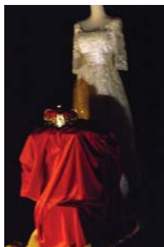
Moi, le violon