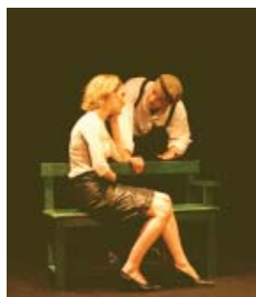
Manuel à Usage des Amoureux

de la Chorale à L'Opéra (Opéra et musique classique par la chorale), du Tableau à l'Image (Histoire de l'art par mise en scène et photographie), du Tableau à la Scène (langage de l'image par l'écriture et le théâtre), Il était une fois le Conte (découverte du patrimoine locale et écriture de conte).