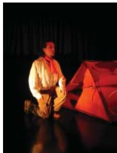
Contes Zé Légendes...

Nous cherchons à pouvoir déplacer nos spectacle partout, et surtout là où il n'y a pas d'équipement culturel, en conservant la même qualité esthétique, visuelle et sonore.