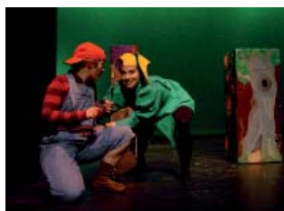
Sur les Chemins Magiques de La Fontaine