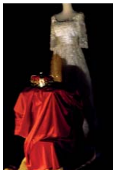
Moi, le violon

La culture rassemble les individus dans ce qu'ils ont de commun : un héritage qui constitue notre mémoire collective, socle de l'identité d'un peuple.