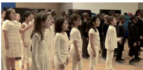
le Roi du Jazz