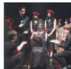
Perséphone Opéra pOp