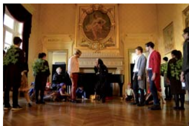
Dans la Forêt Lointaine...

Direction artistique et musicale : Pierre Bugnon. Mise en scène de certains tableaux, direction d'acteurs et de solistes dans des comédies musicales empruntant à toutes les disciplines. Répertoire allant du classique à la variété internationale, en passant par le jazz et le gospel. 150 participants sur scène, de 10 à 65 ans. Représentations à la Salle Olympe de Gougues. Paris 11ème