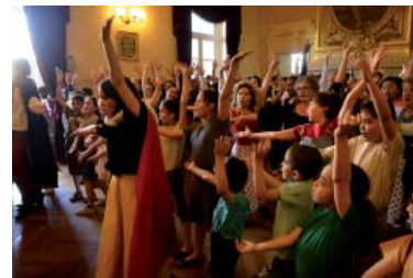
Dans la Forêt Lointaine...