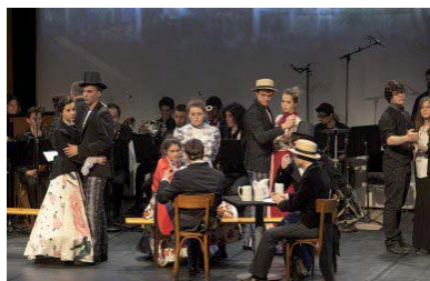
Bal en couleurs, un dimanche en musique