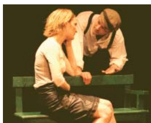
Manuel à Usage des Amoureux