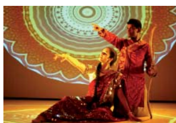
Râma et Sîtâ