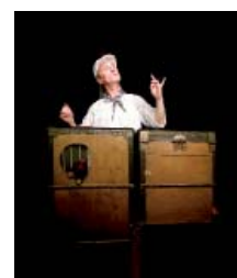
Contes Zé légendes...