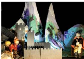
La Princesse sans Sommeil