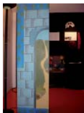
Voyage au Coeur d'une Compagnie