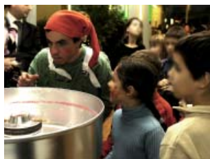
Fantaisies de Noël