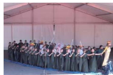
Voyage en EurOpéra